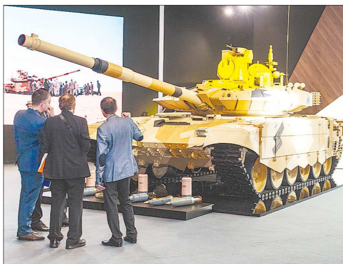
Танки Т-90 разных модификаций — непременные участники всех крупных международных военных выставок

ется дальнейшим развитием разработанного в 1990-е годы основного отечественного танка Т-90 (экспортный вариант — Т-90С). От своей предшественницы новая боевая машина отличается прежде всего конструкцией башни, в которой боекомплект для повышения выживаемости экипажа размещён вне боевого отделения, и модернизированной 125-миллиметровой пушкой с увеличенной длиной ствола. По сравнению с орудиями, которые устанавливались на Т-72Б и предыдущих моделях Т-90, у этой пушки гораздо выше скорострельность (до 12 выстрелов в минуту — как у «Арматы»). Кроме того, Т-90М оборудован новейшей системой управления огнём «Калина» с лазерным дальнометром и интегрированным тепловизионным каналом, и новой модульной динамической защитой от практически всех современных и перспективных противотанковых средств.