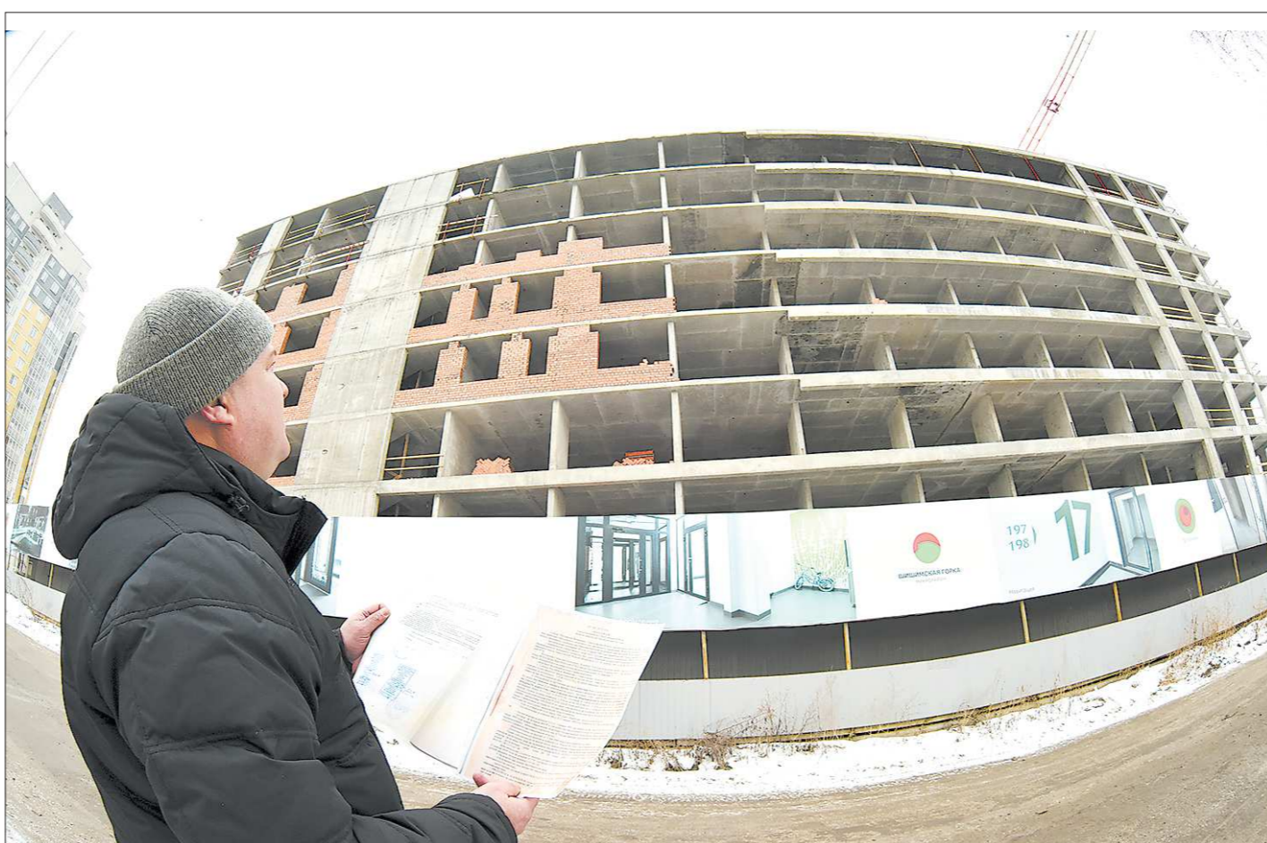
В этом строящемся в районе Уктуса доме приобретена первая в Екатеринбурге квартира по льготной ипотеке 6 процентов

Два социально важных поручения, которые сделал Владимир Путин в конце прошлого года, уже выполняются