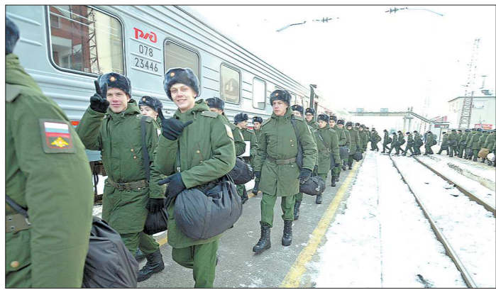
Призывники с областного сборного пункта уезжали во все военные округа России

Очень интенсивно работавший на протяжении трёх последних месяцев (начиная с 1 октября) областной сборный пункт на станции Егоршино Свердловской железной дороги в минувшие выходные опустел. Все прибывшие сюда по повесткам военкоматов призывники разъехались по городам и весям нашей необъятной страны.