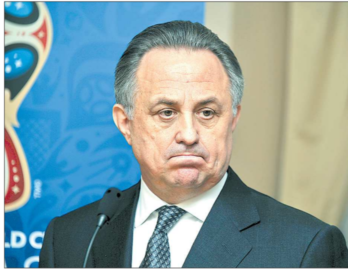
Виталий Мутко намерен судиться с МОК, а на это время покинул пост президента РФС

Тучи над Виталием Мутко сгущаются практически после каждого крупного спортивного мероприятия, в котором принимает участие национальная команда. Казалось бы, после провальных олимпиад министр спорта ещё тогда должен был подавать в отставку. Однако у Виталия Леонтьевича всегда находились отговорки, и фраза «будем работать над ошибками» порой вызвала смех. Все всё прекрасно понимали, однако Виталий Мутко продолжал быть ответственным за спорт в России, а вместо отставки получил даже повышение — стал вице-премьером. То же самое касается футбольных дел. Провалы национальной команды как будто не касались главного футбольного руководителя, он как бы оставался не при делах.