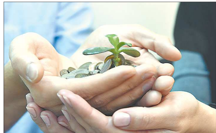
В руках инвестиционного управляющего будет повышение инвестиционной привлекательности Первоуральска

— На производстве, на самом деле, у меня тоже не сахар был. Придя домой, я не знал, через сколько минут меня могут вызвать назад. Непрерывное производство требует постоянного надзора, и бывало так, что я проводил очень много времени на работе. Супруга отнеслась с пониманием, а без поддержки семьи такое решение я бы не принял.