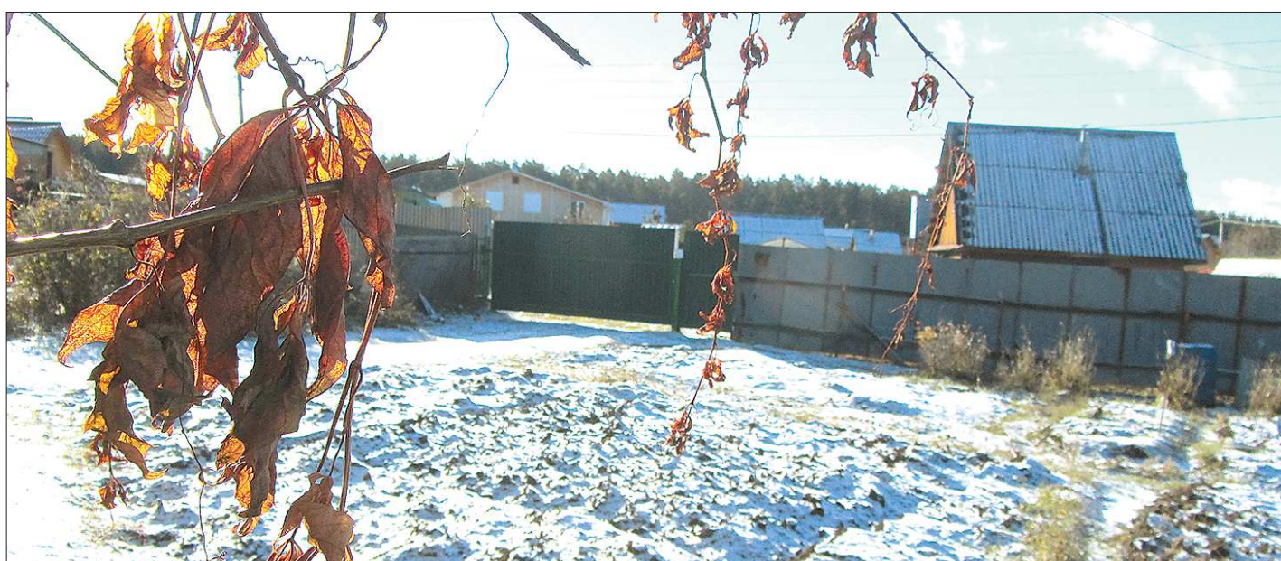
С 1 января 2018 года пенсионеров освобождают от уплаты земельного налога за участки до 6 соток

На 2018 год надзорными органами были запланированы 5 796 проверок, из этого количества прокуратура Свердловской области уже признала 544 проверки незаконно включёнными в план.