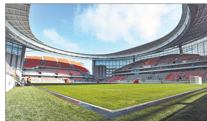
Такой предстала «Екатеринбург Арена» перед комиссией ФИФА в сентябре 2017 года

Однако за два месяца ситуация изменилась. Проект «Ека-