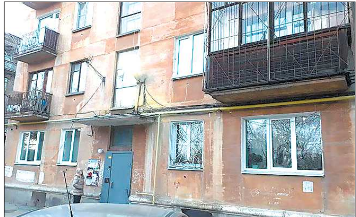
Апартаменты с собственной кухней в этом доме в конце июня сдаются за 31,5 тысячи рублей в сутки

За полгода до чемпионата мира по футболу уральские предприниматели придумали, как заработать на мундиале. В отелях свободных мест почти не осталось, зато появилось большое количество предложений об аренде отдельных апартаментов.