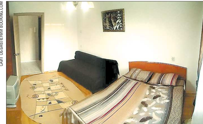
Эту однушку на Амундсена-Бардина в дни чемпионата предлагают снять за 35 тысяч рублей в сутки