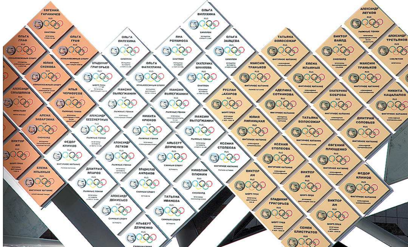
Спустя некоторое время после Олимпиады в Сочи результаты Игр выглядят совершенно иначе: победителями и призёрами стали совсем другие люди... Но на стеле в Олимпийском парке всё по-прежнему так, как решилось по спортивному принципу четыре года назад

Однако мнение спортсменов расходится с мнением российских болельщиков. Как показывают многочисленные опросы, проведённые после официального отстранения МОК российской сборной от Олимпиады, большинство болельщиков считают, что ехать в Корею и выступать под нейтральным флагом не нужно. В этом тоже есть своя прав-