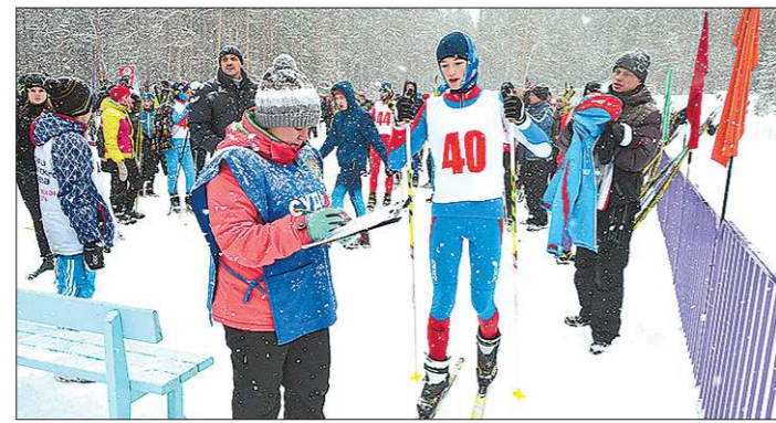
Всего на лыжной трассе в Новоуральске в соревнованиях на призы «ОГ» приняли участие 377 человек