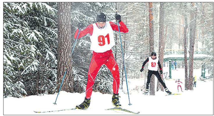
Снега оказалось достаточно не только для классического, но и конькового хода

Здесь, пожалуй, сейчас одно из немногих мест в области, где, несмотря на бесцелье, можно проводить соревнования, — это мнение чле-