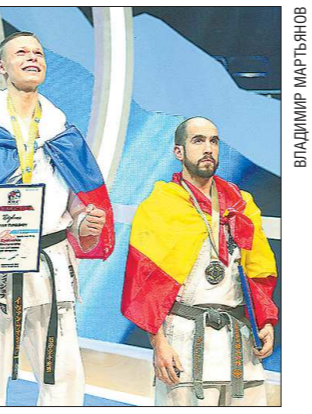
В финале екатеринбуржец одержал победу, несмотря на полученные травмы

Поэтому все поединки имеют примерно одинаковый сценарий: спортсмены сближаются друг с другом и начинают наносить серии ударов руками по корпусу. Кто нанесет сопернику больший урон — тот и победил. Лишь изредка добавлялись удары ногами, которые также были направлены в корпус соперника. Очень мало поединков, кото-