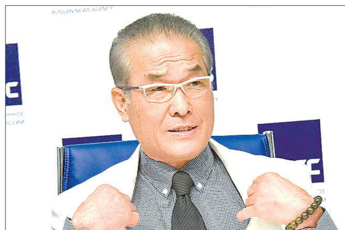
Президент Международной организации кюкюсин Хацуро Рояма посетил Екатеринбург в третий раз

«Было предчувствие, что могу победить?» В финале у вас было сразу три этапа... Да, К первому подготовиться было практически не-