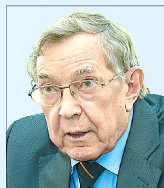
Вениамин ЯКОВЛЕВ Министр юстиции СССР (1989-1990). Последний председатель Высшего арбитражного суда СССР (1991). Советник Президента РФ (с 2005 г.).

Место рождения: село Мур-гук (Дагестан). Год выпуска: 1988. Любительный факт: по национальности дагинец (народ Дагестана, который составляет около 16 процентов населения республики).