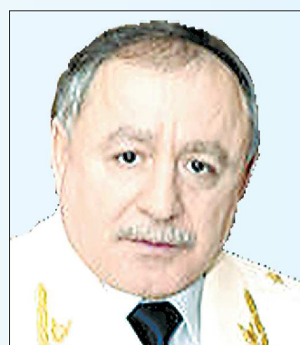
Рамазан ШАХНАЗАРОВ Прокурор Республики Дагестан (с 2013 г.).

Место рождения: город Николаевск-на-Амуре (Хабаровский край). Год выпуска: 1976. Любительный факт: первое место работы — электрик на судостроительном заводе родного города.