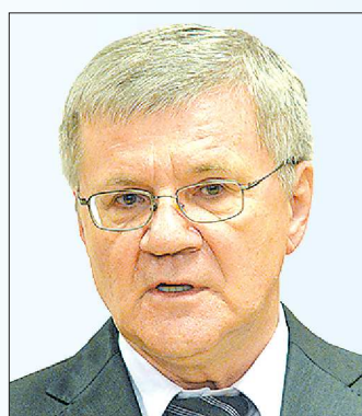
Юрий ЧАЙКА Генеральный прокурор Российской Федерации (с 2006 г.).

Я хотел бы пожелать, чтобы уральский вуз сохранял ту значимость для нашего государства, которую он имеет с советских времен. Здесь готовят лучших юристов.