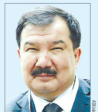
Асхат ДАУЛБАЕВ Генеральный прокурор Республики Казахстан (2011-2016 гг.).