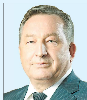
Александр КАРЛИН Губернатор Алтайского края (с 2005 г.).

Место рождения: город Петухово (Курганская область). Год выпуска: 1953. Любительный факт: в возрасте 85 лет увлекается туризмом и лыжным спортом.