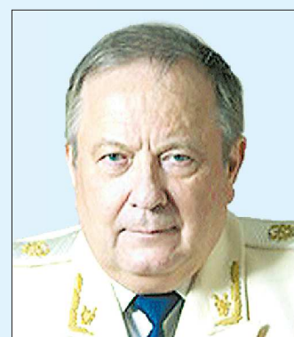
Юрий СКУРАТОВ Генеральный прокурор РФ (1995-1999 гг.).

Председатель Комитета по государственному строительству и законодательству Госдумы РФ. Председатель правления Ассоциации юристов России. Место рождения: город Полевской (Свердловская область). Год выпуска: 1989. Любительный факт: вице-президент хоккейного клуба «Металлург». Почетный гражданин Магнитогорска и Челябинской области.