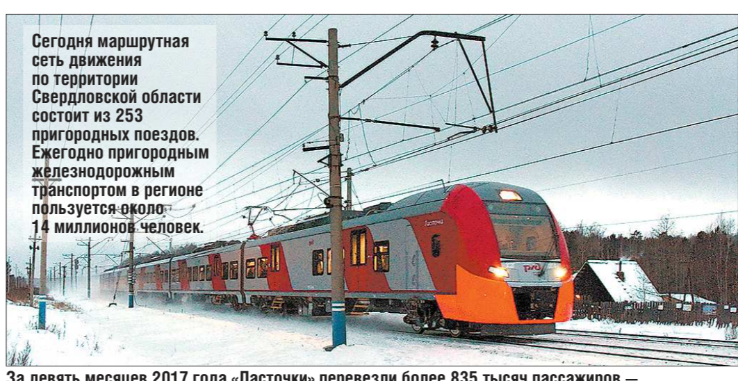
За девять месяцев 2017 года «Ласточки» перевезли более 835 тысяч пассажиров — на 15 процентов больше, чем за тот же период 2016 года. В октябре на Среднем Урале «Ласточка» перевезла двухмиллионного пассажира

— У нас на Среднем Урале сформирована профессиональная команда организаторов выборов — более 26 тысяч человек, работающих в избирательных комиссиях всех уровней. Полагаю, нам всем по плечу качественная организация и проведение предстоящей масштабной и очень важной для всей страны кампании.