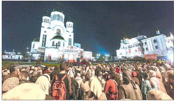
Июль 2017 года. Царские дни. Екатеринбургский Храм-на-Крови построен на месте дома Ипатьева, где была расстреляна царская семья

Представители церкви подчёркивают, что это важно не столько в вопросах канони-