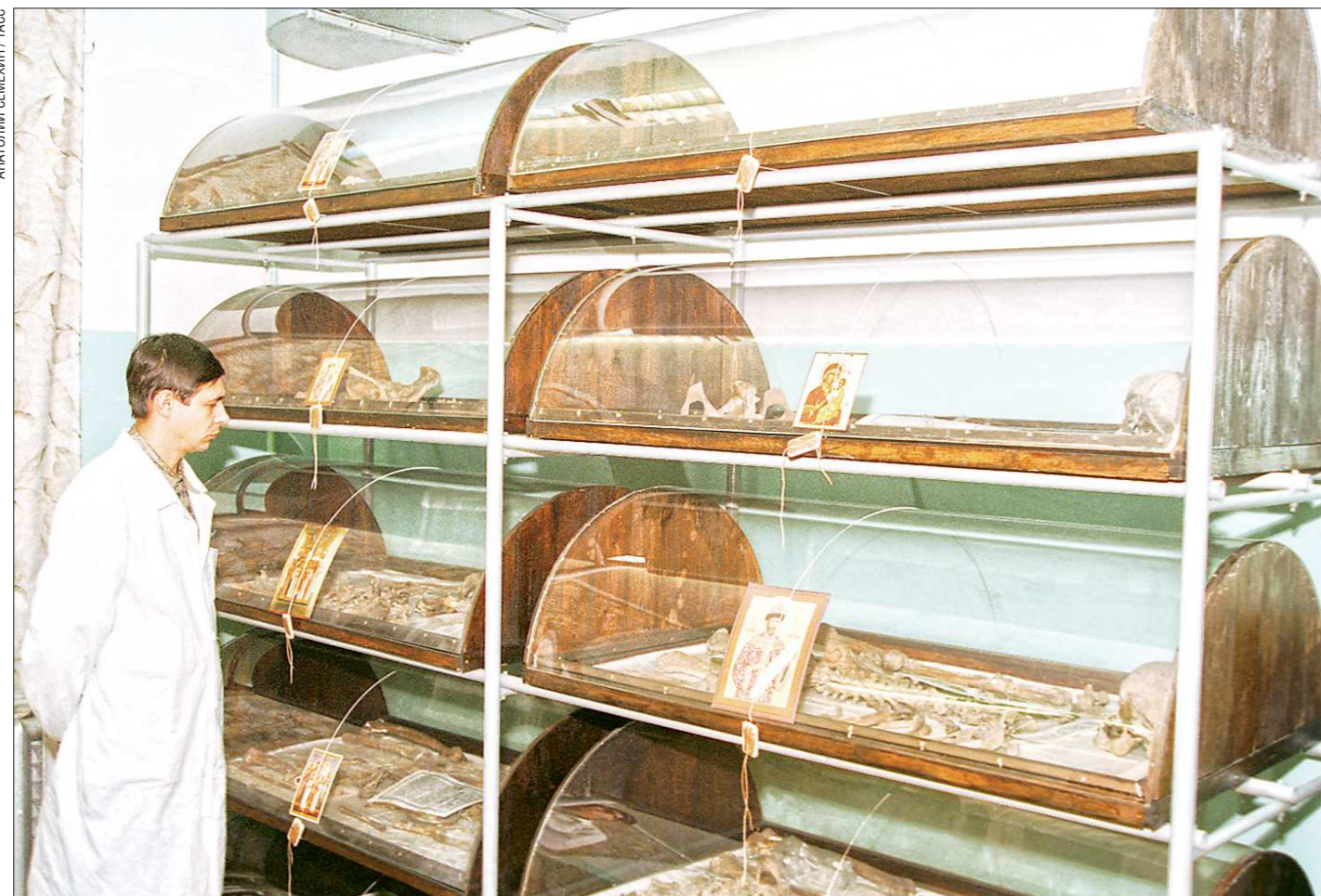
Предполагаемые останки царской семьи в помещении бюро судебно-медицинской экспертизы в Екатеринбурге, 1997 год

В Москве открылся Архиерейский собор Русской православной церкви — именно здесь РПЦ должна была наконец высказать свою официальную позицию о екатеринбургских останках: являются ли они останками семьи Николая II? Но, как оказалось, исследования и экспертизы ещё не завершены. В понедельник в московском Сретенском монастыре состоялась специальная конференция о ходе расследования убийства. Дискуссия, в которой приняли участие юристы, историки, политики, генетики, криминалисты, транслировалась в Интернете и вызвала резонанс