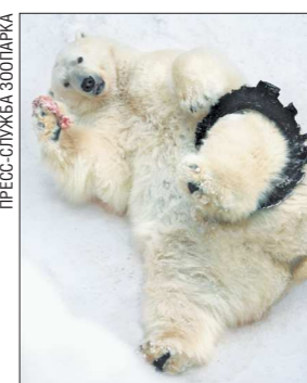
За год Умка и Айна собрали более 500 просмотров

Пара белых медведей Умка и Айна стали самыми популярными животными в «Мобильном аудиогиде» екатеринбургского зоопарка. За год они собрали более 500 просмотров.