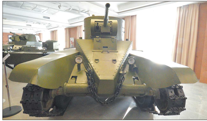
Самый быстрый танк в довоенном мире BT-27

Представьте, к вам приехали гости издалека. Просят, чтобы вы показали им самое интересное, что есть у вас в округе. Куда вы их повезёте? И вам любовь скажет — поезжайте и покажите Храм на Крови, Ганину Яму и музей военной техники в Верхней Пышме.