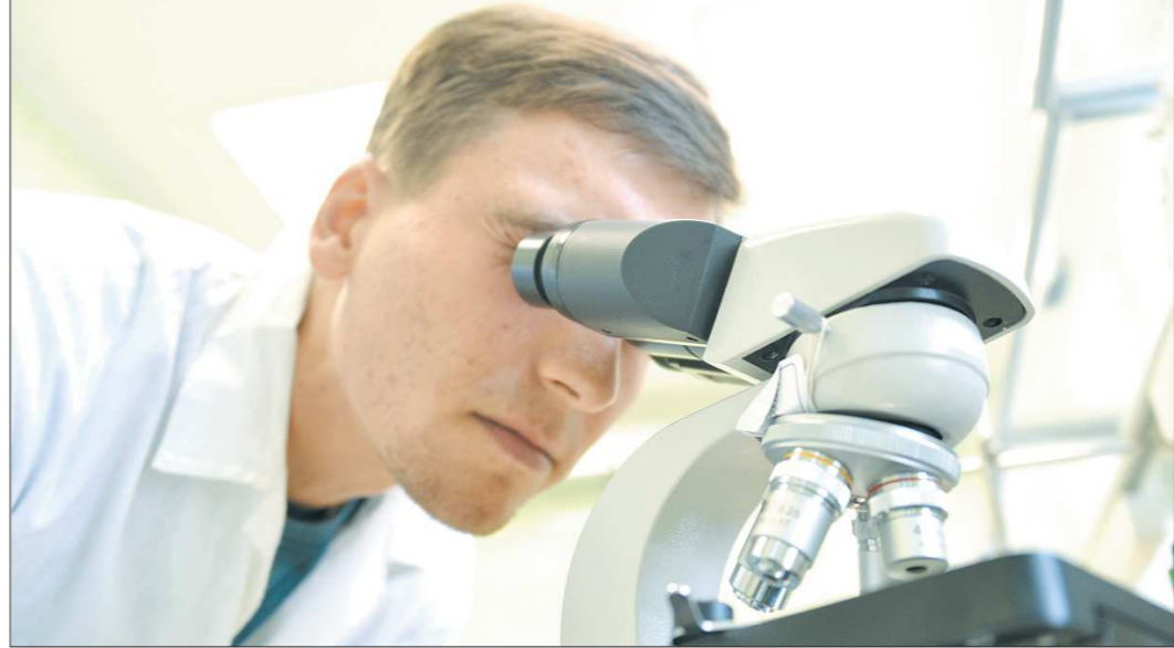
«В науки он вперит ум, алчущий познаний...» А.С. Грибоедов