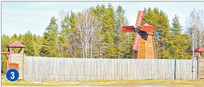
Далее на очереди в Татарской слободе строительство пекарни, пруда, крестьянского подворья, дома ремесленника

крытию были построены главное здание санатория и жилые помещения для больных и персонала.