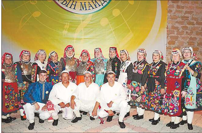
Коллектив «Райхан» был украшением фестиваля