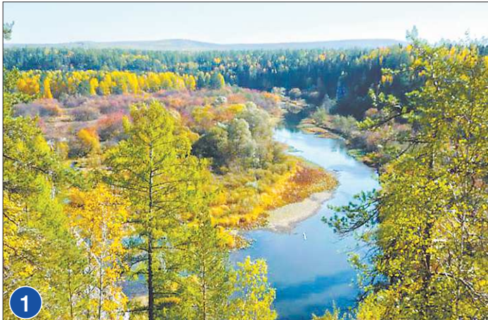
Парк — особо охраняемая природная территория. Его площадь составляет 12 700 га. Основной объект — река Серга с её скалами, пещерами, урочищами. 22 объекта имеют статус памятника природы областного значения