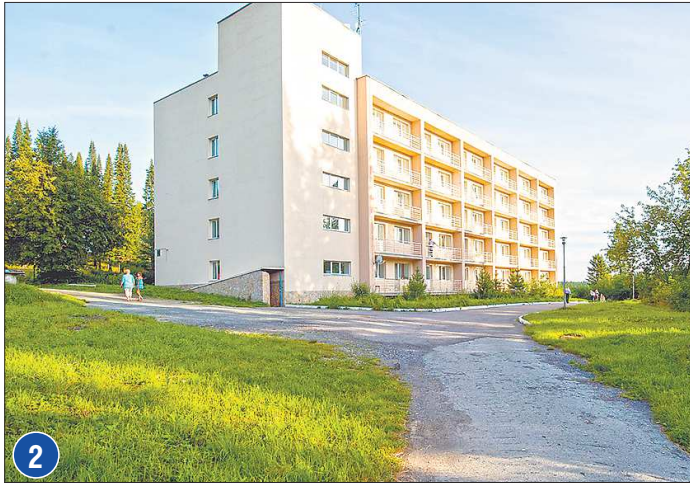
Санаторий «Нижние Серги» приобрёл широкую известность благодаря лечебным свойствам местной минеральной воды, насыщенной хлористым натрием и сероводородом