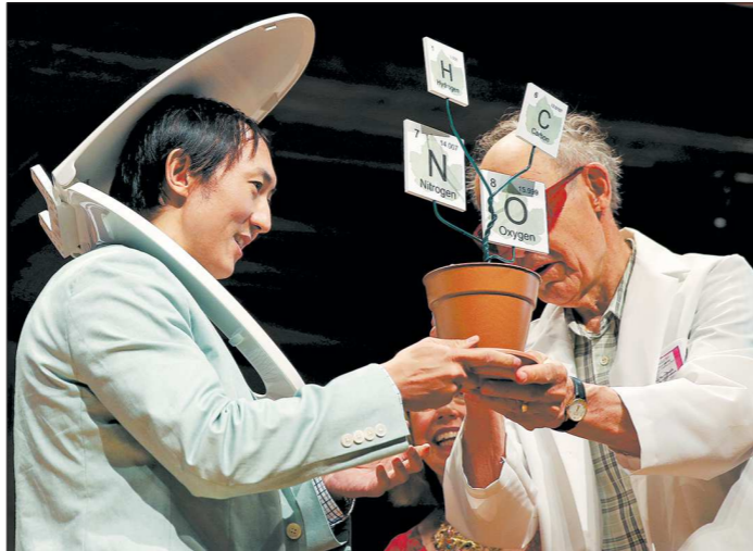
На 25-й церемонии вручения Шнобелевской премии в 2015 году лауреатами по физике стали учёные из Тайваня и США. Они доказали, что почти все млекопитающие вне зависимости от пола и размера опустошают свои мочевые пузыри примерно за одно время (не дольше 21 секунды)

Кстати, учёный российский происхождения Андрей Гейм — пока единственный, кто в разные годы получил обе награды. Сначала ему вручили «Шнобель» — за изучение легирующих лягушек. И, видимо, слегка обидевшись, он вместе с нашим земляком Константином Новосёловым (на фото) занялся серьёзным делом — в 2010 году они в соавторстве получили настоящую Нобелевку по физике.