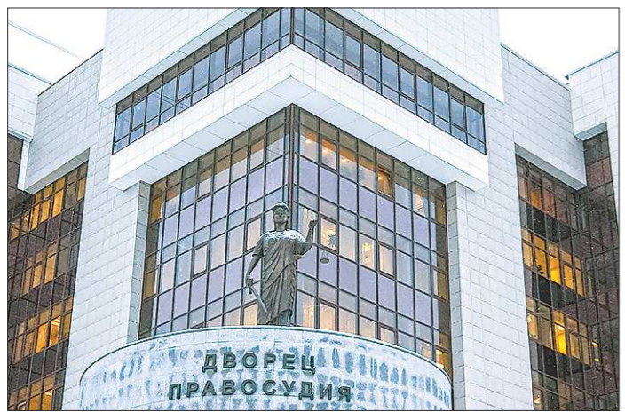
У граждан останется право самостоятельно защищать свои интересы в суде

Директор Среднеуральской птицефабрики Максим Максимов заявил, что уже с 9 октября и до конца месяца запланировано снижение цен на отдельные виды продукции в фирменных магазинах, оно составит до 8 процентов на четверть, голень, бедро и крыло: — Нельзя исключать продления этой акции, но планы на более длительный срок спрогнозировать сложно: пшеница составляет в рационе птицы до 50 процентов, необходимо дождаться результатов уборки соевых бобов и подсолнечника. Они будут известны в декабре.