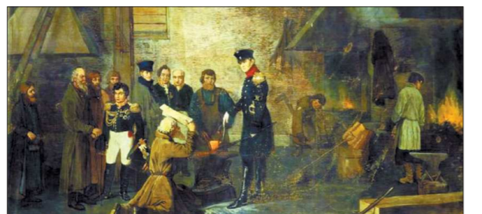
На Нижне-Исетском заводе к царю обратились староверы с просьбой разрешить им установить крест на их моленной доме. Царь разрешил. Этот момент впоследствии был увековечен русским художником, уроженцем Екатеринбурга Алексеем Корзухиным в картине «Царь Александр I на Нижне-Исетском железодельном заводе в 1824 г.» (1877)