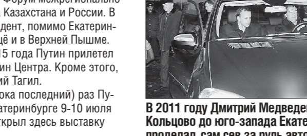
В 2011 году Дмитрий Медведев путь от аэропорта Кольцово до юго-запада Екатеринбурга проделал, сам сев за руль автомобиля

В 2011-м Медведев побывал в Екатеринбурге дважды: 1 февраля (главный пункт программы — участие в открытии памятника Борису Ельцину) и 28 ноября (пуск станции метро «Ботаническая» и посещение жилого микрорайона «Академический»).