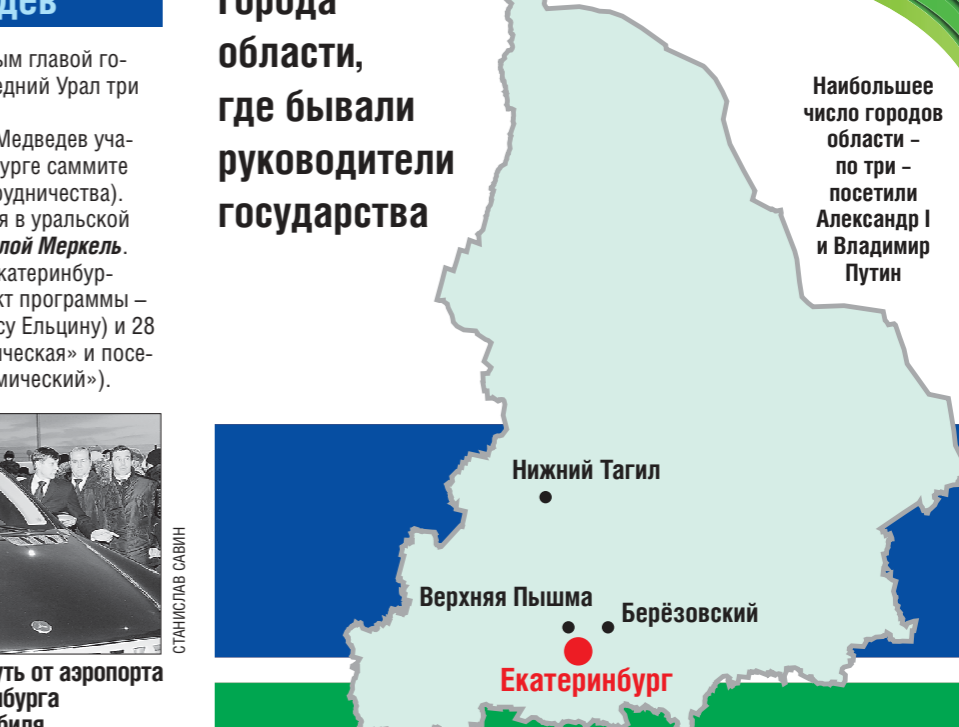
Наибольшее число городов области — по три — посетили Александр I и Владимир Путин