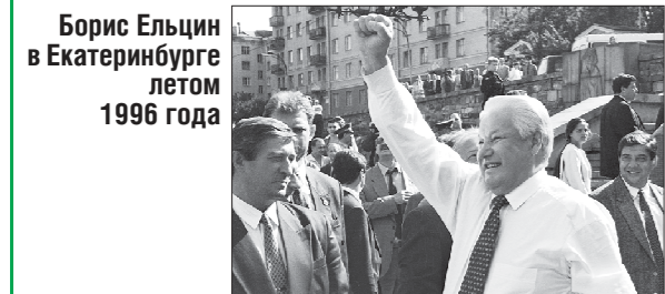
Борис Ельцин в Екатеринбурге летом 1996 года

В марте 1998 года Ельцин хотел провести в Екатеринбурге встречу с главами Франции и Германии, но по настоянию врачей саммит был перенесён в подмосковный пансионат «Бор».