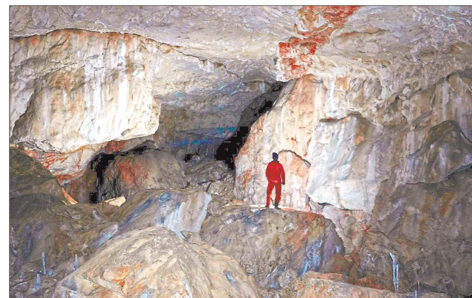
Спелеоподводная экспедиция в пещеры Старателей и Присковую

— Мы очень рады тому, что нас отметили на премии Russian Event Awards. Наш центр, который открылся в ноябре 2013 года, был создан как раз с целью представления туристского потенциала Нижнего Тагила на международных выставках, форумах, конференциях, а также организации информационных туров и событийных мероприятий. Центр ведёт активную политику по созданию единого туристско-информационного пространства. За годы существования запущены городские туристские интернет-порталы, активно наполняются наши аккаунты в социальных сетях, где представлена информация, раскрывающая туристский потенциал Нижнего Тагила. Наш центр, следуя современным тенденциям развития туризма, активно работает в направлении событийного туризма, организуя ряд масштабных мероприятий: «Фестиваль современного танца «Break Down T. City of Dance», Всемирный день туризма, этнографический фестиваль «Тагильский калейдоскоп» и другие, а также оказывает информационную поддержку крупнейшим мероприятиям, проводимым в нашем городе. Они получили поддержку правительства Свердловской области. Наши мероприятия ежегодно становятся лауреатами и обладателями награды крупнейших всероссийских и региональных туристских премий: Всероссийская открытая ярмарка событийного туризма Russia Open Event Expo, национальная премия в области событийного туризма Russian Event Awards, международный конкурс «Туристский бренд: лучшие практики».