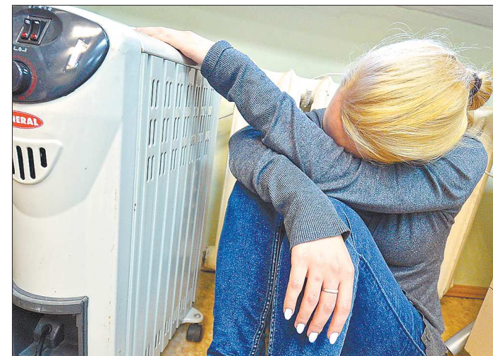
Жителей Берёзовского не обрадовала новость о предстоящем повышении цены на тепло

Жителей заинтересовал вопрос — почему повышению тарифа подвергнется только центральный микрорайон — Советский? Всё дело в том, что здесь преобладают многоквартирные, сети используются активно и уже давно нуждаются в позитивном ремонте. Заместитель главы по вопросам строительства и ЖКХ