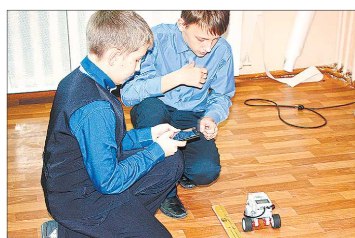
Ученики сами собирают из конструктора модели и учатся ими управлять. Некоторые уже мечтают о том, чтобы работать с настоящими роботизированными комплексами на заводах