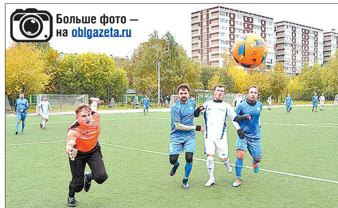
В футбольном матче игрокам команды диспетчеров-энергетиков (на фото — в синей форме) не всегда удавалось сдерживать атаки коллег-соперников

Перед игрой участники признавались, что в их диспетчерской работе крайне важны те качества, которые развивает футбол: единство команды, чувство плеча, нацеленность на результат. А реакция на любые штатные и нештатные ситуации помогает мгновенно принимать решение и на футбольном поле. — Такие командные виды спорта укрепляют коллектив, — отмечает начальник группы корпоративной социальной политики филиала «Аэ-