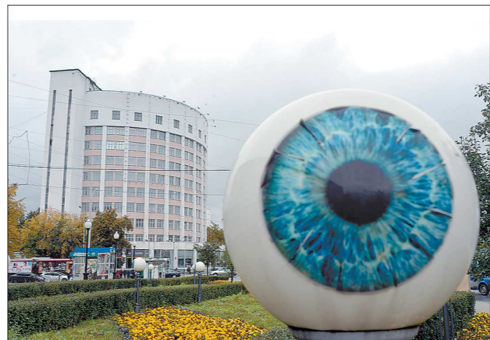
В советское время на гостинице «Исеть» была надпись «Вперёд к коммунизму»

Очевидно, что до принятия решения на эту тему будет вы-