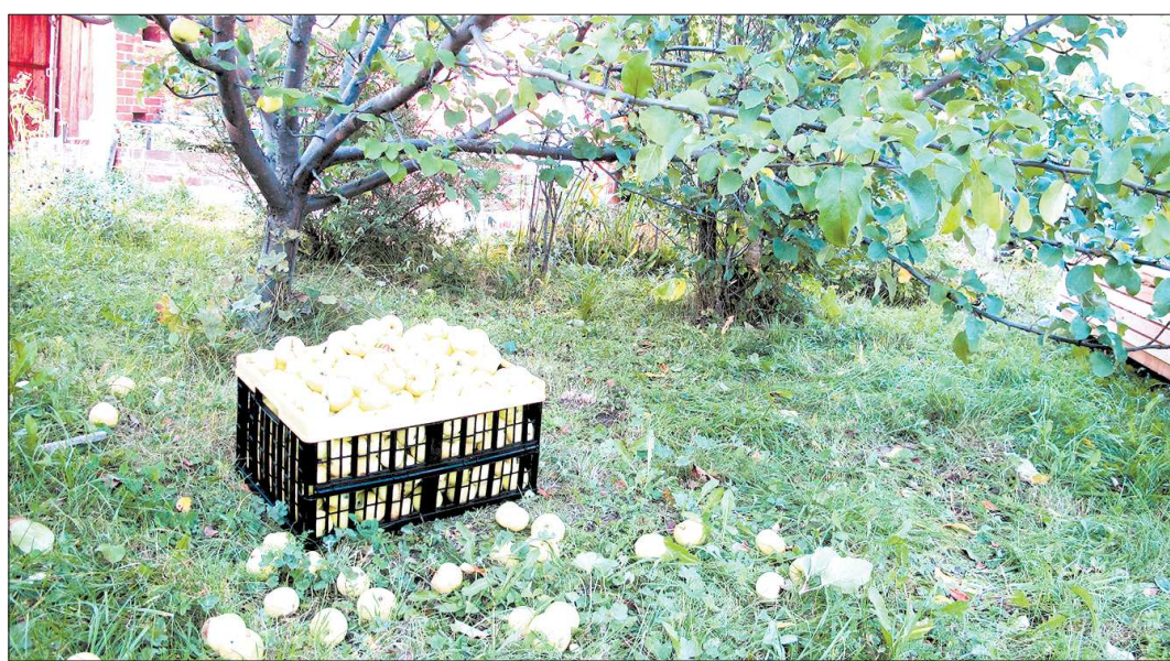
Упавшие на землю плоды храниться уже не будут

нас служили ориентиром календарные сроки. Допустим, мы знали, что приступать к уборке плодов яблоны сорта Экранное нужно с 15 сентября — плюс-минус два дня, на эти сроки и ориентировались. У груши Скоропелка Свердловская (или другое её название Талица) к сбору плодов приступали с 17 августа — это начало их созревания. В этом году всё перемешалось и перепуталось. Нынешнее лето у нас было холодным, и прежде ранжирование по срокам созревания не сработало. Потому что некоторые сорта в холодную погоду лучше себя чувствуют, чем другие, которым тепла для созревания требуется больше. В этом году даже некоторые осенние сорта яблоны обогнали летние и созревали раньше. В эти выходные, например, у некоторых садоводов сорт яблоны Уралец уже осыпался, а ведь это осенний сорт. А рядом — висят плоды на сортах яблоны летнего срока созревания, ещё не на-