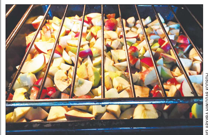
Сушёные яблоны до самого лета будут отличным источником витаминов

постараться максимально быстрее их убрать в холод. Задача садовода в это время — найти самое прохладное место на участке, это не обязательно может быть овиоцная яма, возможно, на веранде в эти дни будет холоднее, чем в погребе, где воздух остывает медленнее. Оптимальная температура для хране-