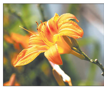
Лилейники могут переносить зиму без укрытия

● КЛЕМАТИСЫ. Крупноцветковые растения цветут на побегах прошлого года, поэтому их нельзя обрезать до основания — надо оставлять стебли примерно полметра — двух метров длиной. Однако на Среднем Урале неподготовленные к морозам эти сорта клематисов могут не пережить зиму. Их укладка на зиму не так проста. Первое — основание куста непременно мульчируют опилом или перегноем. Второе — подрезанные стебли скручивают в колечко, укладывают на подстилку из сухих листьев или опилок. И третье — сверху надо поставить каркас: коробку засыпать сухими листьями или опилками, а затем за-