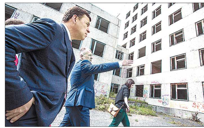
В августе Евгений Куйвашев оценил состояние долгостроя — вместо него теперь решили возвести новое, добротное здание

Еще один плюс — никаких бумаг! Распечатывать электронный билет не придётся. Достаточно сохранить его на мобильном устройстве и показать контролёру прямо на экране. Вместе с электронным билетом нужно будет предъявить паспорт. Это обязательное условие, о котором мобильное приложение напомнит при оформлении проездного документа. Приложение