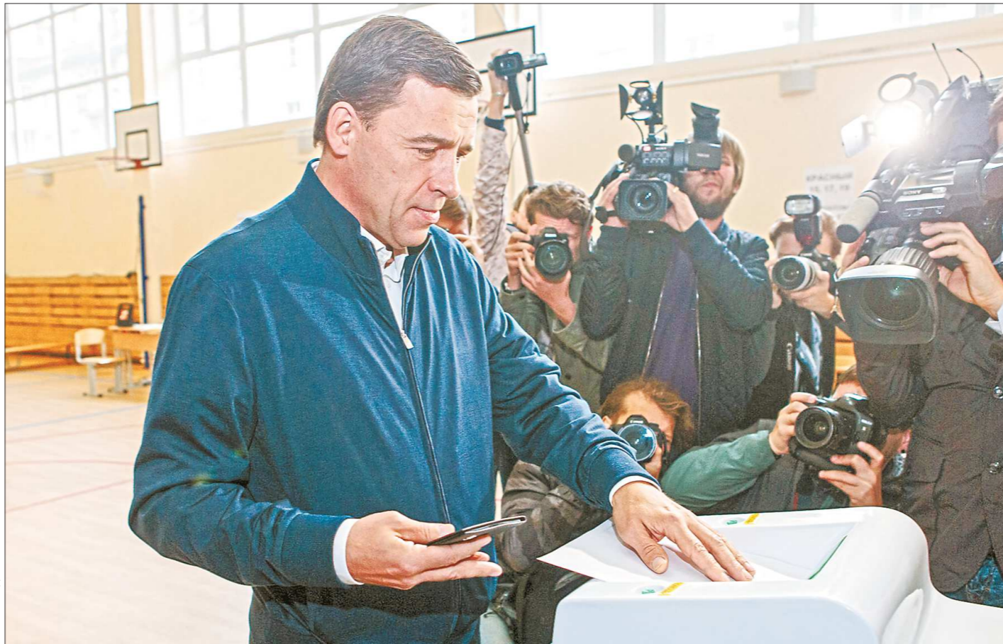
ОБЛАСТНОЙ ДЕПАРТАМЕНТ ИНФОРМАТИКИ

— Члены избиркома своевременно реагировали на все сигналы о возможных нарушениях. Серьёзных нарушений, способных повлиять на итоги выборов в Свердловской области, на избирательных участках в муниципалитетах региона не зафиксировано, — заявил он после закрытия участков.