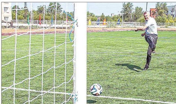
Сергей Носов на выборах главы Нижнего Тагила одержал уверенную победу

— Действительно, в Свердловской области есть ряд муниципалитетов, для которых подобные результаты выборов не являются чем-то extraordinary, — считает политолог Анатолий Тагарин. — Тому есть несколько причин. Во-первых, то, что в политическом пространстве в этих территориях есть группы, имеющие отношение к «Единой России», и те, что вступили в конфронтацию с партией. Часто во вторую группу попадают бывшие мэры или руководители городских дум, которые собирают вокруг себя оппозиционных депутатов в пике местных выборов. Возникают личностно-групповые противоречия, которые приобретают партийно-политическую окраску. Во-вторых, это может быть связано со слабостью местной ячейки «Единой России», которая не всегда должным образом укомплектована профессиональными кадрами, обладающими определённой репутацией. В любом случае, для того чтобы не допустить разразившихся конфликтных ситуаций, мэры должны обладать дипломатическими способностями, искать причины противоречий и решать их. Тогда недопонимания между думами и администрацией не возникнет.