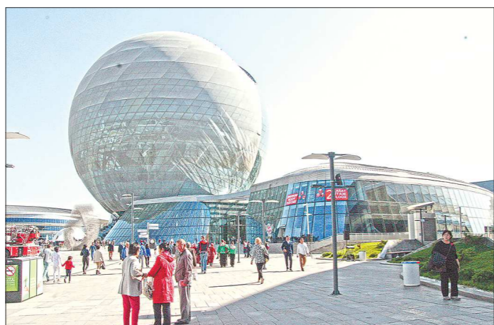
Экспозиция Казахстана расположена на восьми этажах здания в форме шара. Площадь павильона хозяев выставки — около 20 тысяч квадратных метров

ЭКСПО-парк — это настоящий город, раскинувшийся на 174 гектарах на окраине столицы Казахстана. Широкие дороги и огромные парковки — первое, что встречает гостей выставки. Далее кассы и пункт досмотра. Когда попадаешь на территорию парка, сразу бросается в глаза сферический восьмигранный павильон Нур-Алем диаметром 80 метров. В нём можно изучить новые источники энергии — воды, ветра, солнца, космоса, биомассы и т.д. Вокруг гигантского шара высятся 14 зданий, в которых разместились международ-