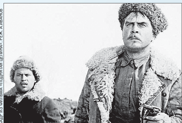
Уникальный случай: звание присуждено человеку, никогда не жившему в Свердловской области - кинорежиссёру и актеру Евгению Матвееву. Со Средним Уралом его связывает только то, что он несколько лет был депутатом Верховного Совета РСФСР от Ленинского района Свердловска