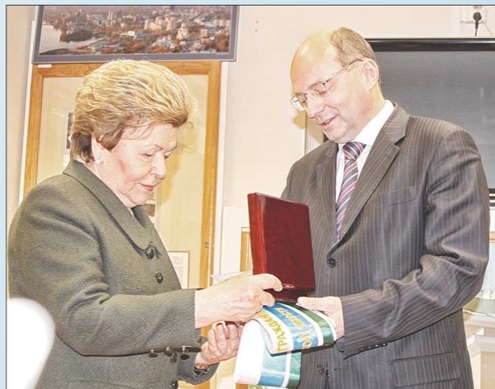
Звание впервые присуждено посмертно - первому Президенту России Борису Ельцину