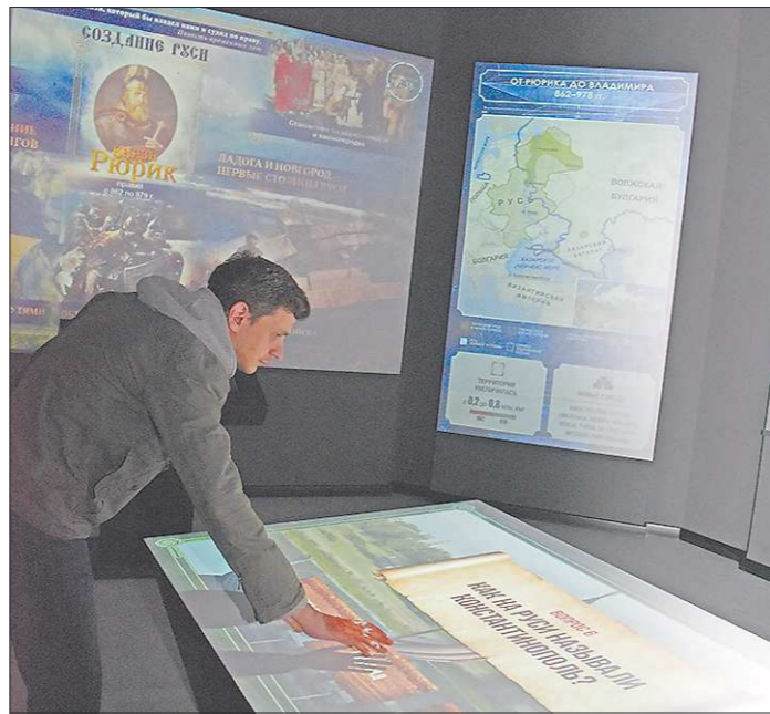
В мультимедийном парке можно пройти тест на знание истории

Хочет ли того или нет мультимедийный парк, в ближайшие годы его так или иначе будут сравнивать с Ельцин Центром. Их главное отличие — охват исторического периода. Ельцин Центр в большей степени является концептуальным музеем, сосредоточенным на эпохе первого Президента России. Исторический парк, в свою очередь, пытается охватить всю совокупность событий, произошедших на