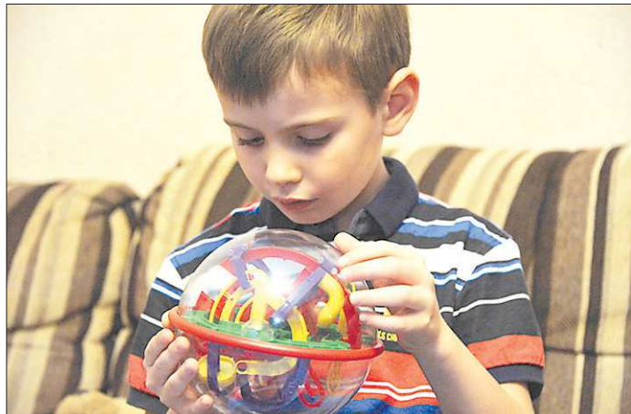
У ребёнка должна быть возможность побыть наедине со своими мыслями