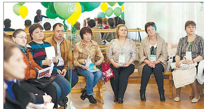
Самые активные и творческие семьи осенью поедут на Всероссийский этап Ассамблеи замещающих семей