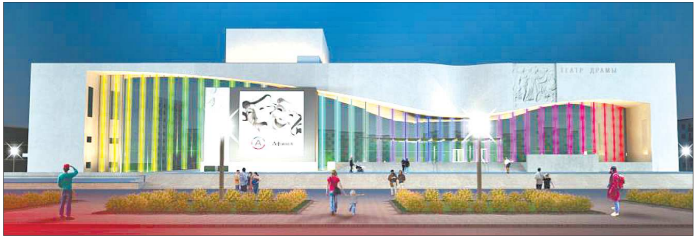
Проект нового театра выполнен архитектурной мастерской из Новосибирска. Здание должно разместиться на месте бывшего Байновского сада, который является началом бульвара Парижской Коммуны – пешеходной зоны, спускающейся к берегу реки Исеть

Самые отважные и непоседливые зрители соберутся в два часа ночи на площади у Драмтеатра, где состоится финальный гала-концерт. Завершится он по традиции с первым лучом солнца (который должен появиться в 4 часа 5 минут и 55 секунд) исполнением подходящей случаю песни из мультфильма про «Бременских музыкантов».