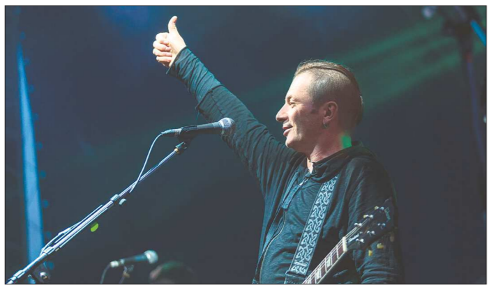
Вадим Самойлов кроме выступления проведёт мастер-класс для школьных музыкальных групп, которые приедут к нам со всей страны