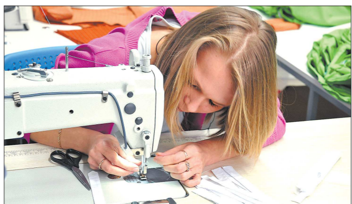
И швее, и маляр — востребованные профессии у абитуриентов с ограниченными возможностями здоровья

— Похоже, вы — антиглобалист? — Знаете, в немецком языке есть слово «jein» — среднее между «ja» (да) и «nein» (нет). По-русски — да и нет. Вот ответ на ваш вопрос, а сошлусь от целей, во имя которых принципы одной страны начинают определять что-то в другой. Наши журналистские контакты — уж точно не попытка давления. Мы «пришли» на Урал не диктовать своё, а обмениваться своим профессиональным опытом. Союз наш творческий. Это попытка решать общие проблемы единого информационного пространства.