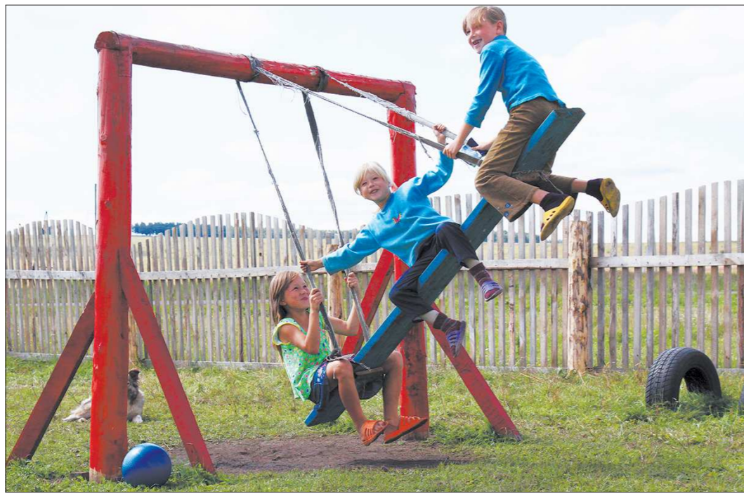
Правительство РФ к осени утвердит план мероприятий до 2020 года. А в проекте на 10 лет будут учтены все «детские» программы и стратегии, которые действуют в стране