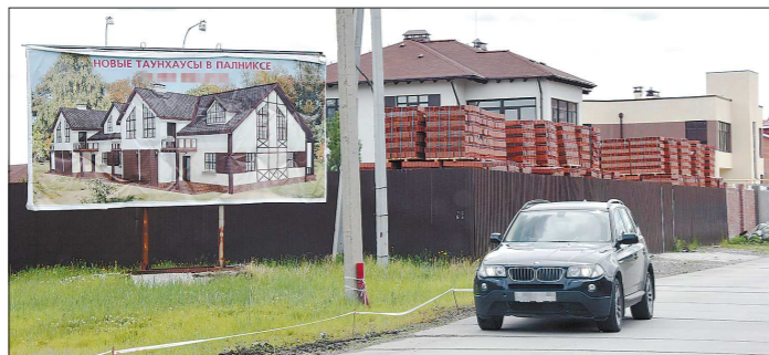
«Паликис» — старейший коттеджный посёлок в Екатеринбурге. Землю под первую очередь выделили ещё в 1996 году

В Екатеринбурге и окрестностях на конец первого квартала 2017 года в разных стадиях строительства насчитывается 234 коттеджных посёлка.