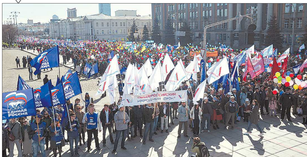
Праздничные мероприятия 1 мая прошли по всей Свердловской области. В торжествах приняли участие более 100 тысяч человек...