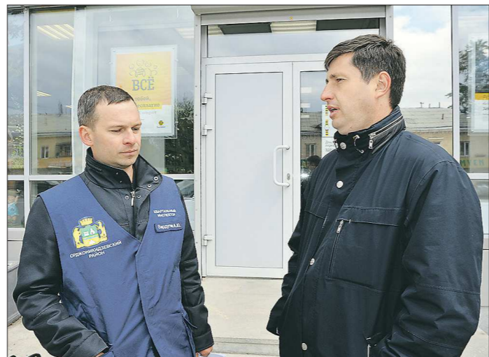
В этом году у квартальных также появились синие жилеты. Теперь инспекторов можно узнать по форме