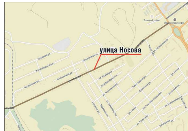
Старобазарная была переименована в улицу Носова в начале 70-х годов прошлого века. Это одна из самых длинных улиц Нижнего Тагила