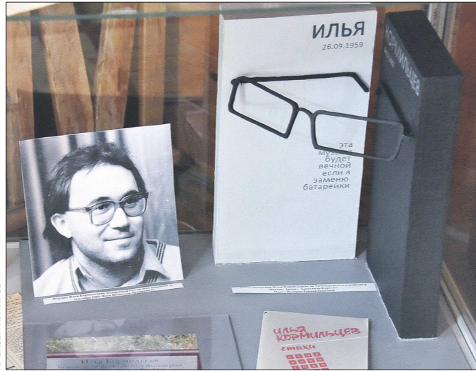
В витрине, посвящённой автору текстов большинства песен «Наутилуса» Илье Кормильцеву, представлен макет памятника, установленного на могиле поэта на Троекуровском кладбище в Москве, и первая официально изданная книжка стихов «Скованные одной цепью»