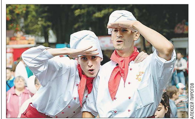
Вкусный и душевный фестиваль – совсем скоро, лучшие повара города ждут вас

ликий Усэйн Болт должны быть лишены золотых медалей за победу в мужской эстафете 4x100 метров. Но все же прекрасно понимаем, что Болт – это солнце современной лёгкой атлетики, пятен на котором быть не должно. Как говорил один герой советского фильма – «Алмаз – это аттракцион! Это имя! Афиша, публика, касса!» А кто же будет в здравом уме своими руками резать курицу, которая несёт золотые яйца? А вот суд и расправа над российскими девушками не заставили себя ждать. В итоге через восемь лет после финиша (!) олимпийскими чемпионками стали легкоатлетки Бельгии, нигерийкам бронзу сменили на серебро, оставшаяся в Пекине без медалей Бразилия получила бронзу. Вот только того сладкого ощущения победы у них всё равно не было и никогда не будет.