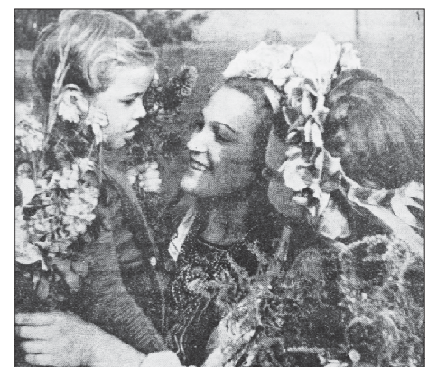
Маленькая немецкая девочка дарит цветы солистам Уральского народного хора после выступления

65 лет назад (в 1951 году) в Берлине состоялся концерт победителей III Всемирного фестиваля молодёжи и студентов. В их число был включён и Уральский государственный народный хор, занявший первое место в номинации «Народные коллективы».