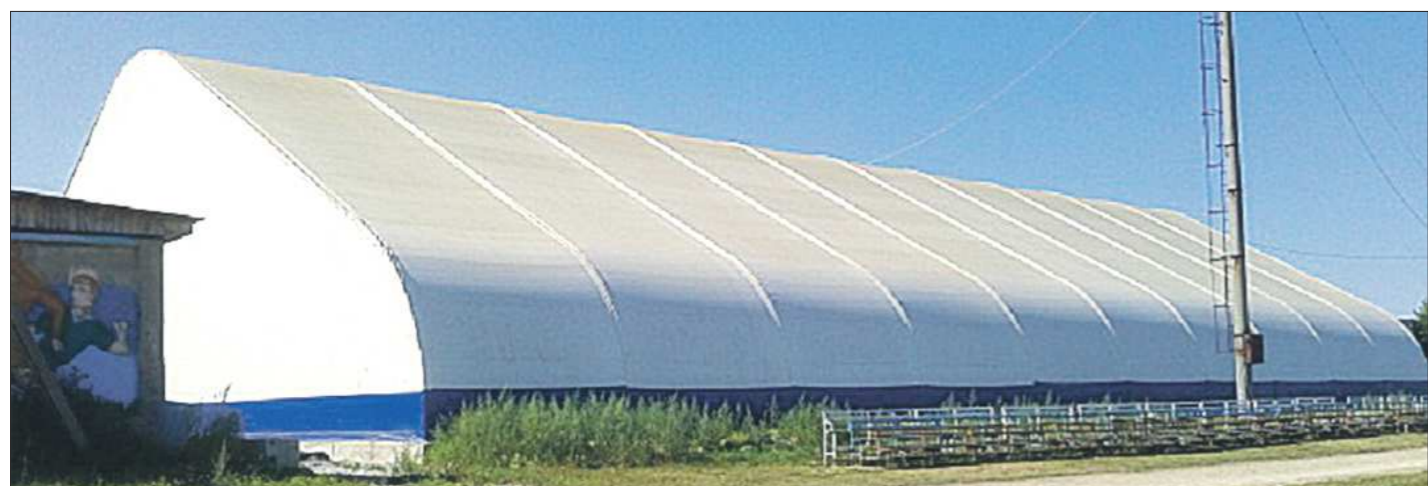
Так выглядит корт в Верхнем Тагиле — проект себя хорошо зарекомендовал, поэтому его взяли за основу и в Верхней Салде. Конструкция создаёт эффект термоса: летом внутри прохладно, зимой — тепло

— Музей истории Екатеринбурга — это музей с человеческим лицом. Он очень чутко относится к людям нашего города. Поэтому было очень много «вкусных», красивых выставок. Абсолютной вершиной я считаю «Выставку исчезнувших запахов». Это — шедевр. Я много разных выставок видел в разных городах и странах, но это просто великолепно. Она входит в ТОП-10 моих самых любимых выставок в мире. По-человечески поразила выставка «Эвакуация. Всегда». Также запомнились «Преступление и наказание» и «Путешествие свердловского турмена». В общем, целый ряд выставок, где город раскрывается через людей, через нашу жизнь. Для меня это очень правильный подход, который я буду стараться поддерживать.