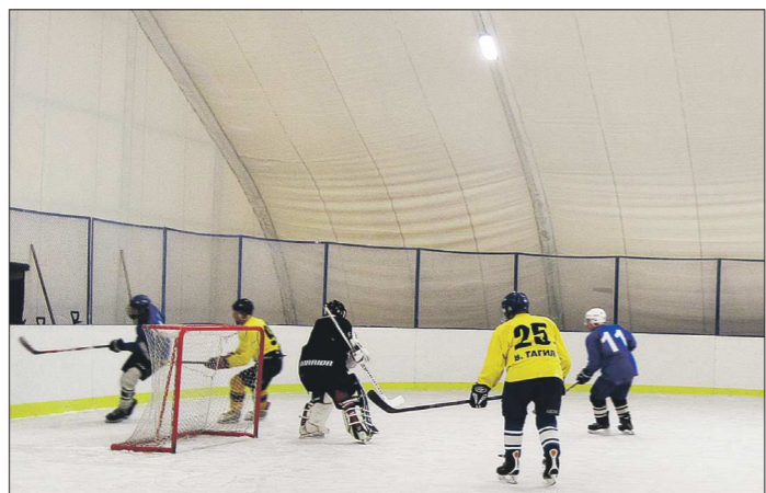
Верхнетагильский корт начал работать в ноябре. Здесь с утра до ночи занимаются фигуристы и хоккеисты — как местные, так и из окрестных городов

— Каток мы построили с помощью области, затратив 21 миллион рублей, а заливочную машину подарили мест-