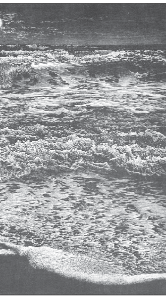
Одно из самых масштабных полотен Айвазовского, представленных на выставке, – «Крейсер в море ночью»