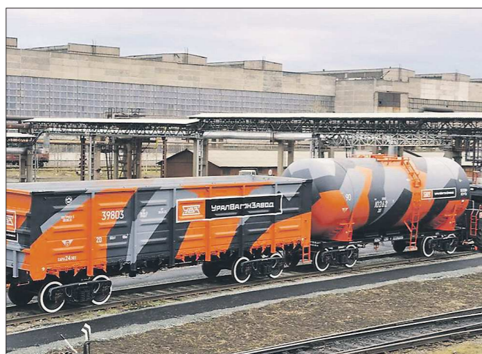
В прошлом году российские вагоностроители отработали только на 30 процентов своей загрузки

Сложности с заказами на железнодорожные вагоны УВЗ стал испытывать с конца 2014 года. С этого момента предприятие работало в таком режиме, когда в вынужденных отпусках находи-