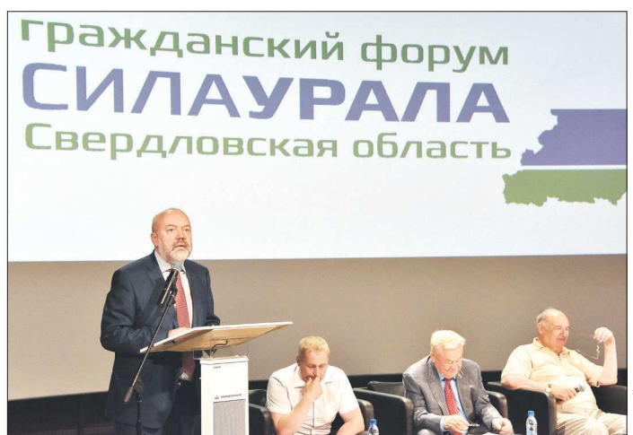
Павел Крашенинников считает, что в нашем регионе работают достаточно зрелые институты гражданского общества, объединяющие большое число образованных людей, которые осознают свои возможности влиять на решения органов власти

— Все контрольные и надзорные органы, которые существуют внутри власти, надзирают сами за собой. Как правило, мы видим эффективность их работы уже в виде посадок чиновников. А чтобы не позволять им нарушать закон, нужен общественный контроль. Именно он препятствует зарождению той заразы, которую, надеюсь без притока, нам периодически демонстрирует власть. Поэтому