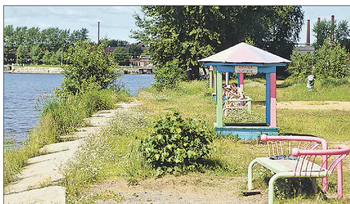
На оборудованных городских пляжах, подобных кушвинскому, безопасно и чисто, в отличие от несанкционированных купальных мест, заваленных горами мусора

В большинстве муниципалитетов власти не считают нужным заниматься обустройством объектов, которые востребованы всего несколько недель в году. Но нынешнее лето стало исключением — купальный сезон затянулся, и муниципалитеты оказались к этому не готовы. Оправдывая своё бездействие, руководители городов ссылаются на несоответствие воды в водоёмах санитарным нормам, сложный порядок разрешительных процедур и дороговиз-