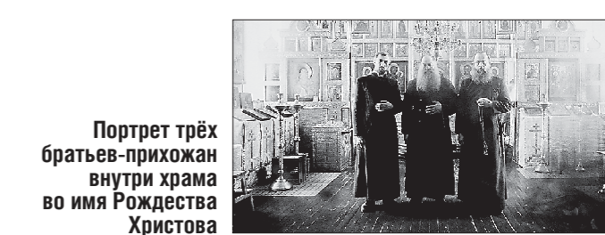
Портрет трёх братьев-прихожан внутри храма во имя Рождества Христова

Всего в конкурсе участвовали фотожурналисты из 71 страны.