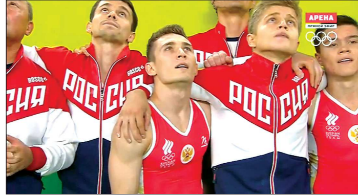
Эти секунды казались вечностью. Через мгновение на табло появятся результаты — и станет ясно, что сборной России удалось сохранить второе место. Тогда уже никто не сдерживал слёз...

Вообще, на Играх в Рио-де-Жанейро Средний Урал представлен пятью городами — Екатеринбург, Нижний Тагил, Каменском-Уральским, Новоуральском и Лесным. В неофициальном олимпийском зачёте среди городов Свердловской области, который ве-