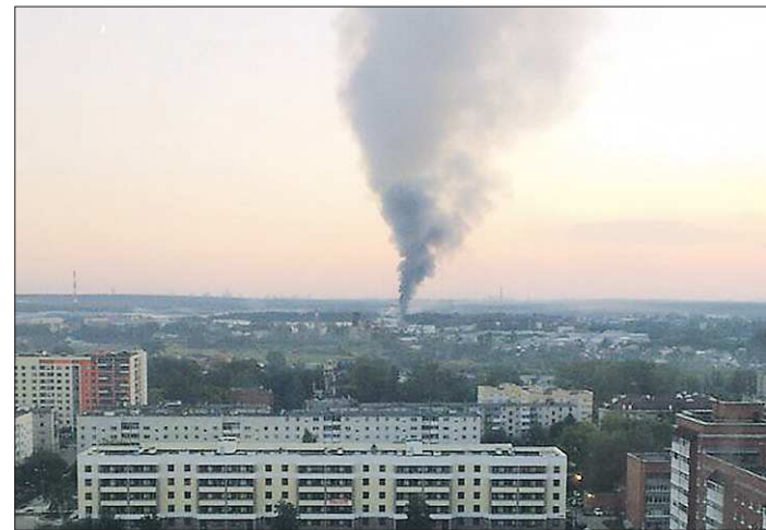
Дым и запах гари вечером 8 августа заметили жители не только Берёзовского, но и Екатеринбурга

Немаловажно и участие СвЖД в пополнении бюджетов всех уровней: в первом полугодии дорога перечислила почти 9,5 миллиарда рублей налогов. В том числе более двух миллиардов — в бюджет Свердловской области.