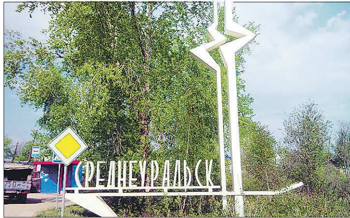
Кандидаты делают акцент на том, что Среднеуральск должен развиваться в составе агломерации «Большой Екатеринбург»