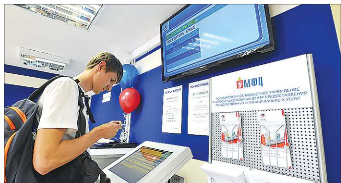
Список услуг, предоставляемых многофункциональными центрами, постоянно пополняется. В настоящее время в нём более 200 позиций