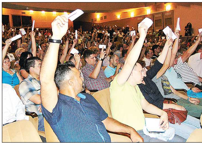
По текущим вопросам делегаты голосовали открытым способом — поднимая вверх мандаты. А вот председателя выбирали тайным голосованием

Профком также борется за улучшение условий труда, рассматривает трудовые споры,