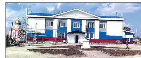
С открытием школы бокса в волчанской ДЮСШ планируют увеличить количество воспитанников. Тренерский состав останется прежним

В этом году в Волчанске заработает реконструированная ДЮСШ, на базе которой появится своя школа бокса. Во время рабочей поездки в северную территорию ход работ на объекте оценили председатель правительства Свердловской области Денис Паслер и министр строительства и развития инфраструктуры области Сергей Бидьонко.