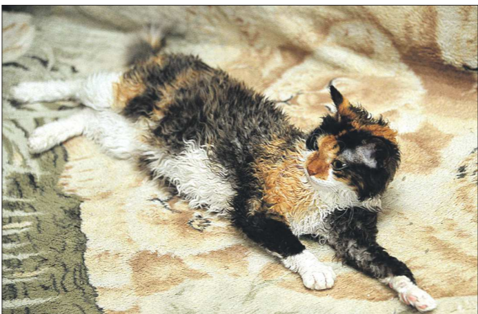
В мире насчитывается не более 400 Уральских рексов, больше всего питомников (пять) - в Екатеринбурге, а за границей эту породу разводят только в Германии. Средняя цена котёнка - 20 тысяч рублей