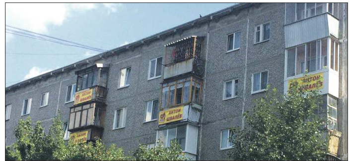
Сразу четыре владельца квартир по адресу Металлургов, 12 рискуют быть оштрафованными

— На каждом агитационном материале должны быть выходные данные, его обязательно нужно согласовывать