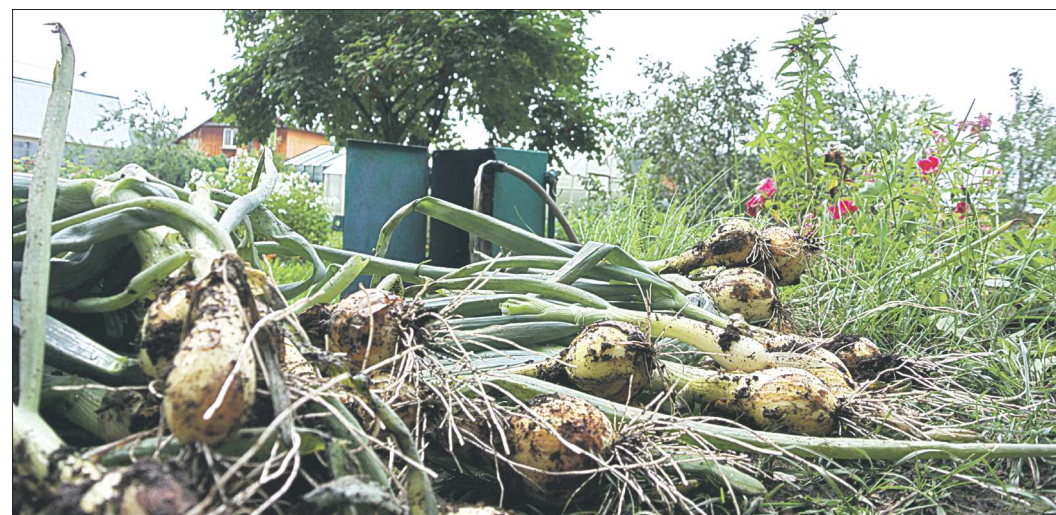
Для сбора урожая лука выбирают солнечные дни. Если зелень у него ещё не высохла, готовить для хранения эту культуру придётся дольше и тщательнее