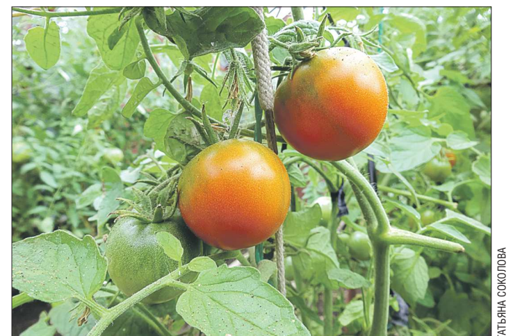
Если листья томата дают много тени или мешают в проходе, то можно убрать лишь несколько сегментов листа – сам лист при этом свою функцию накопителя питательных веществ не потеряет