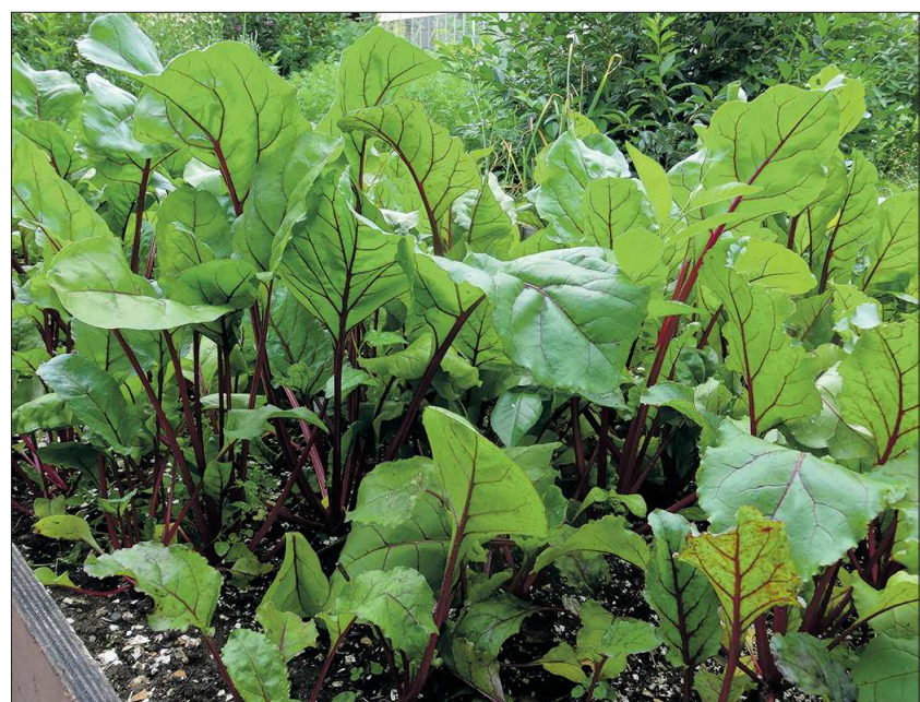
В листьях свёклы содержится множество полезных веществ, поэтому их не стоит выкидывать – лучше добавьте их в салат или в суп