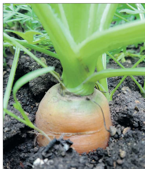
Для лучшего созревания морковь можно подкормить магнием и калием